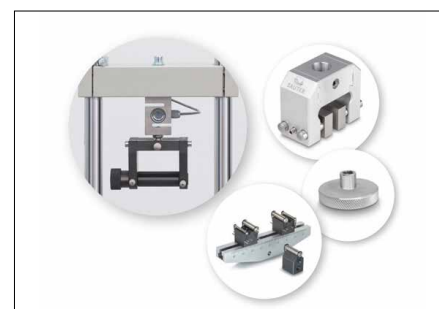
Opzioni di montaggio solide e flessibili di numerosi morsetti e accessori della gamma SAUTER, vedi Accessori