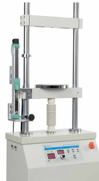
Banco di prova motorizzato incl. sistema di misurazione della lunghezza LD